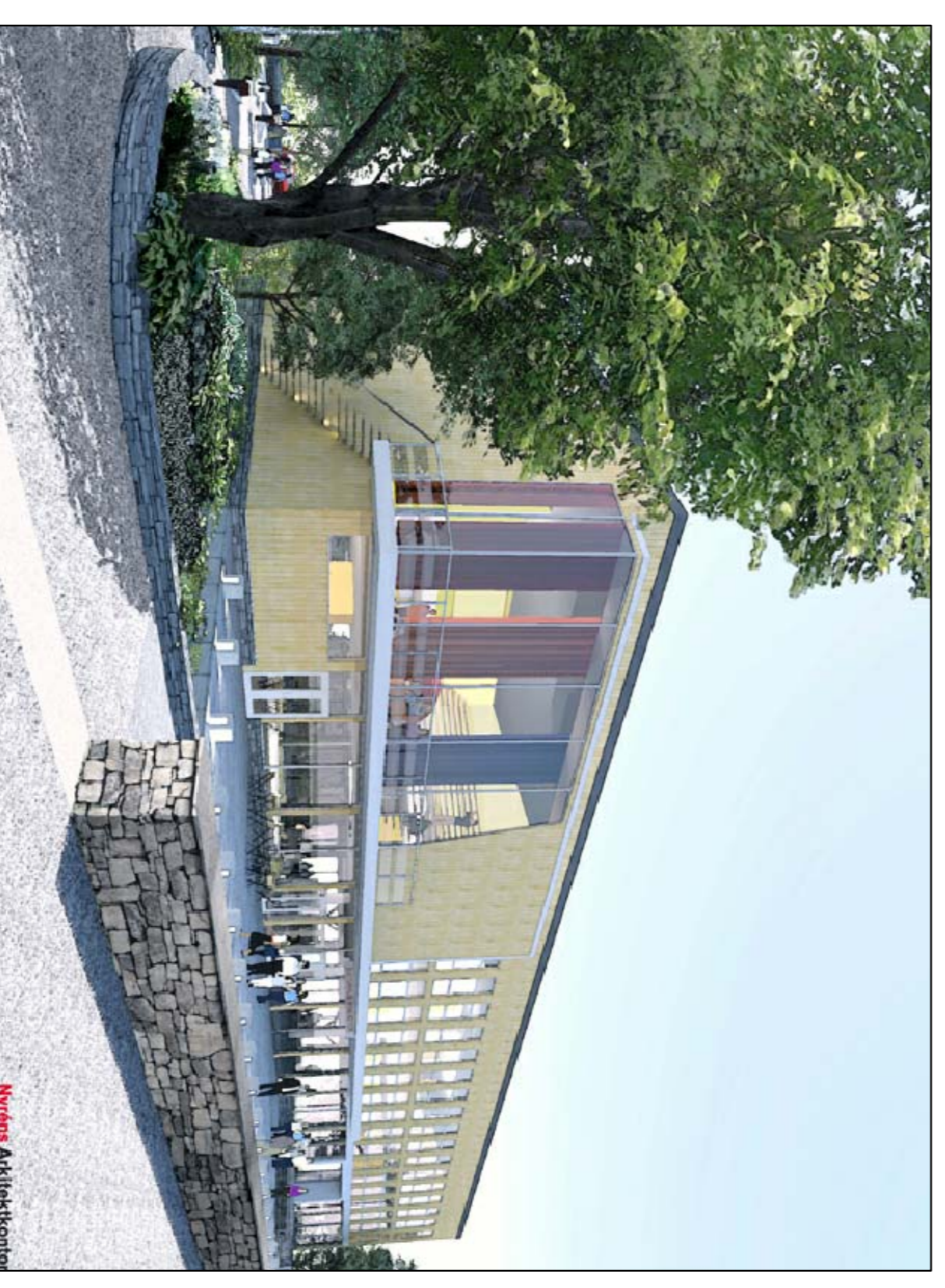
Bibliotek och kulturhuset sett från Allévägen. Vy A på illustrationsplanen. Illustration av Nyvris arkitektkontor.